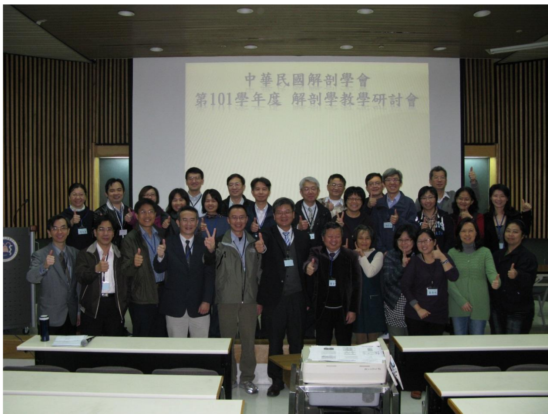
第 101 學年度 解剖學教學研討會圓滿成功